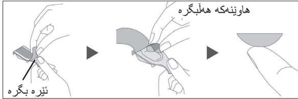
وينه ي 2