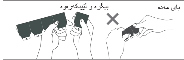
وينه ي 1